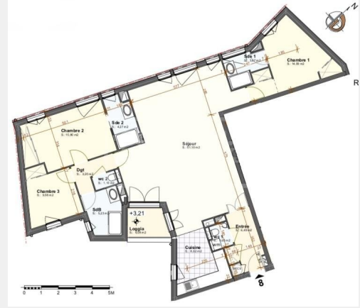
Tableau des surfaces