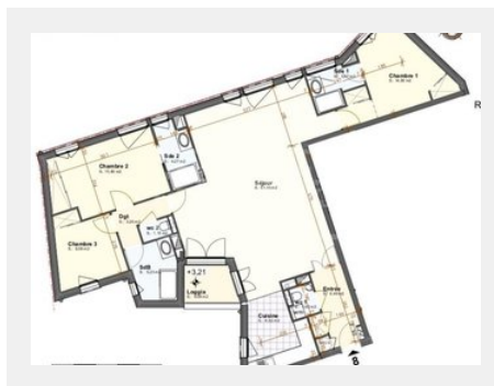
Tableau des surfaces